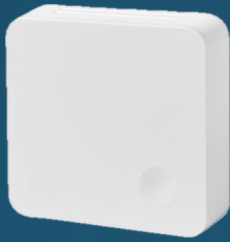
Lämpötila- ja kosteusanturi